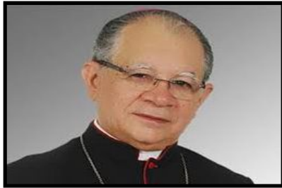
Dom Genvál Saraiva Bispo Emérito de Palmares (PE)

A cada ano, a fé cristã e a sensibilidade humana se colocam diante de um mistério que lhes fala muito – o nascimento de Jesus. A natureza celebrativa, a participação pastoral e a linguagem simbólica estão intimamente