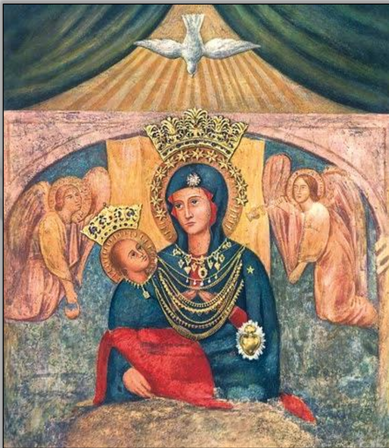
Nossa Senhora do Divino Amor

Numa videomensagem, o Papa pede à Virgem Milagrosa do Santuário de Castel di Leva “proteção” neste momento de emergência devido ao corona vírus.