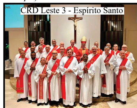
CRD Leste 3 - Espírito Santo