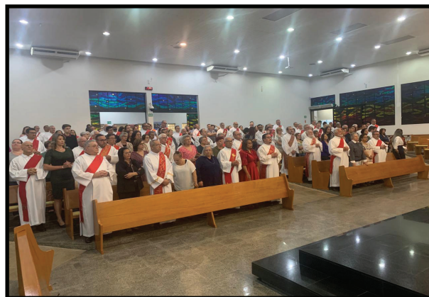
Diocese de Jundiaí (SP)