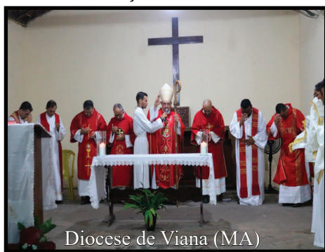
Diocese de Viana (MA)