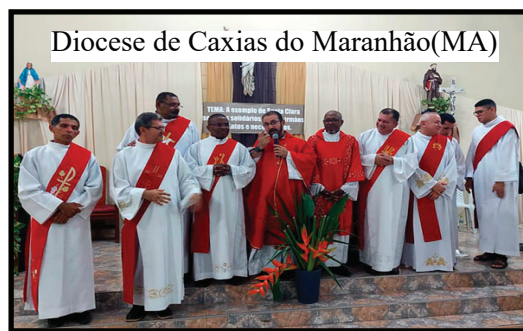
Diocese de Caxias do Maranhão (MA)