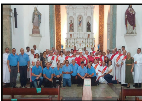
Arquidiocese de Natal (RN)