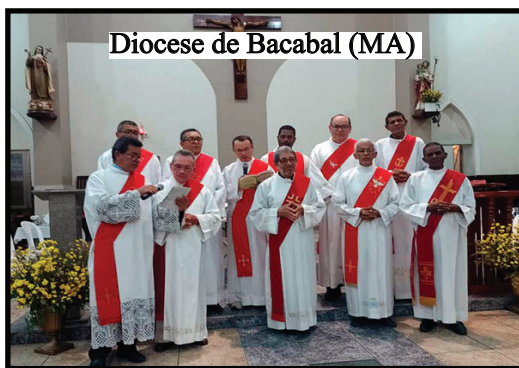
Diocese de Bacabal (MA)