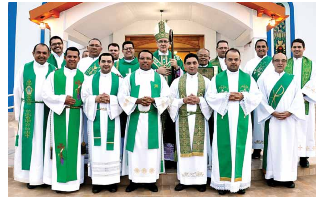
As comemorações começam com uma missa na Matriz de Nossa Senhora da Glória, em Rubiataba, às 9h de domingo dia 11 de outubro/2015.

O primeiro Bispo Prelado foi dom JUVENAL Roriz, CSSR - de 27 de outubro de 1966, até cinco de maio de 1978. Dom JOSÉ CARLOS de Oliveira, CSSR, de 14 de