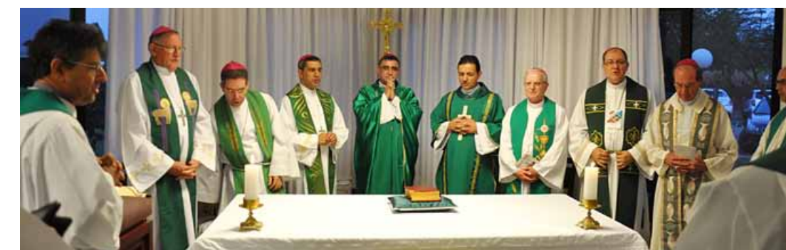
Bispos, padres, diáconos e coordenadores de pastorais, movimentos e organismos da CNBB/CO participaram das celebrações eucarísticas; e dos debates em plenário.