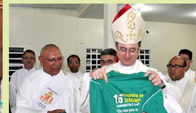
O diác. Damasceno, presidente da CRD/CO, entrega uma camiseta do Encontro ao presidente da CNBB e arcebispo metropolitano de Brasília, dom Sérgio.

ação de Deus. “O Chamado não precede a missão, mas há cumplicidade entre Chamado e Missão”. Num segundo momento, dom Waldemar falou do Diaconado Permanente como ministério de fé e amor e afirmou que “a Igreja é uma comunidade de fé onde Deus se encarna na situação humana”; advertindo que quando há a “idolatria”, acontece a busca do próprio eu”.