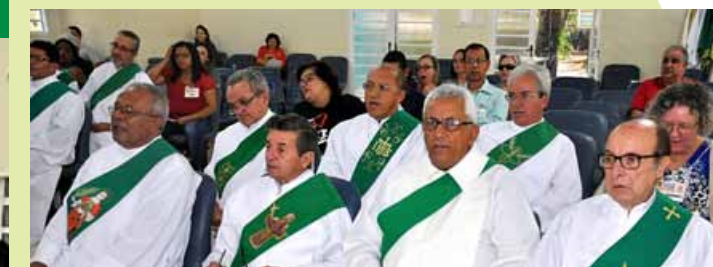
Diáconos de todas as dioceses do Centro-Oeste participaram do Encontro em Brasília.