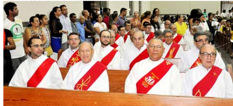
Diáconos de Brasília, Anápolis e Goiânia participaram da Missa Solene de Ordenação dos novos diáconos de Goiânia