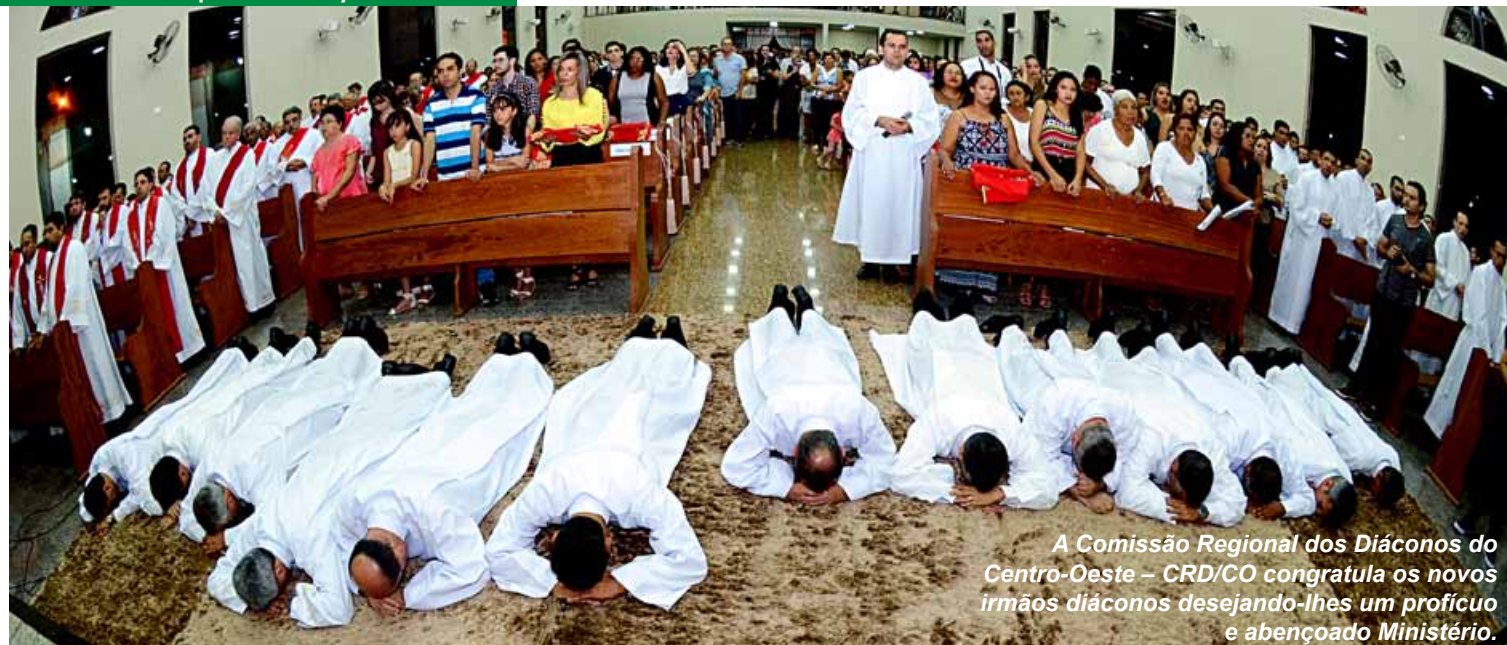
A Comissão Regional dos Diáconos do Centro-Oeste - CRD/CO congratula os novos irmãos diáconos desejando-lhes um profícuo e abençoado Ministério.