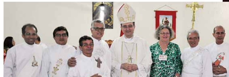
Os diáconos de Anápolis presentes ao Encontro em Brasília com o presidente da CNBB e arcebispo de Brasília, dom Sérgio da Rocha