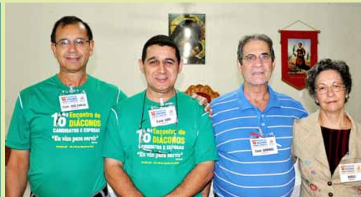
Candidatos e esposas da Diocese de Itumbiara

A Comissão Regional dos Diáconos do Centro-Oeste (CRD/CO) comunicou que o próximo Encontro será em Anápolis, nos dias 26, 27 e 28 de agosto de 2016.