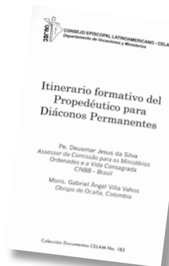
Livro publicado pelo CELAM

Itinerário Formativo do Propedêutico para os Diáconos Permanentes tem apresentação do padre Hugo Boeta López, Secretário do Departamento de Vocações e Ministérios (DEVYM), e está na Colección Documentos CELAM n° 183 . Brevemente será publicado em português.