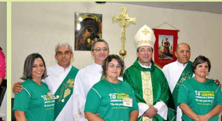
Diáconos e esposas de Itapuranga, Diocese de Goiás, com dom Aparecido