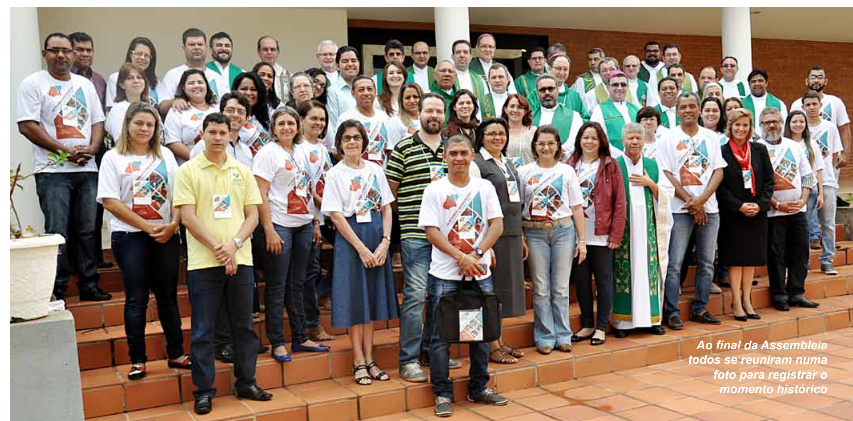
Ao final da Assembleia todos se reuniram numa foto para registrar o momento histórico