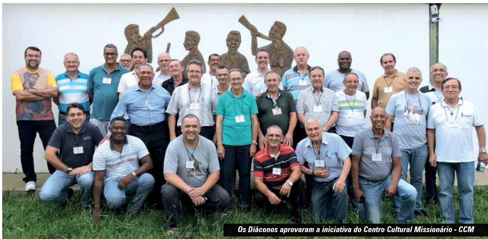
Os Diáconos aprovaram a iniciativa do Centro Cultural Missionário - CCM