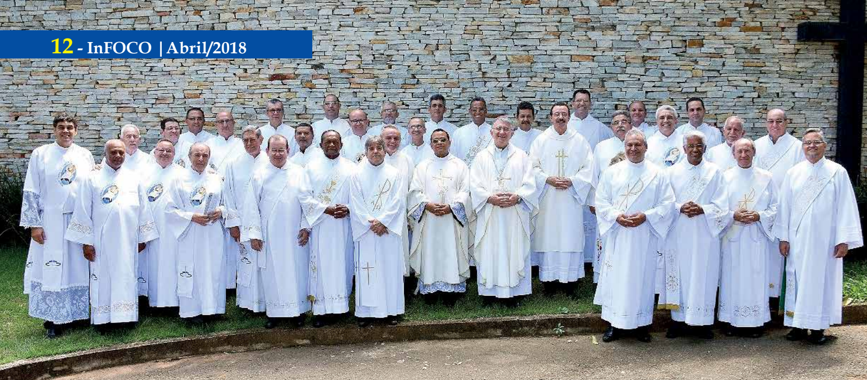
Os Diáconos da arquidiocese de Goiânia refletiram sobre o chamado à santidade na Exortação Apostólica Gaudete et Exultate