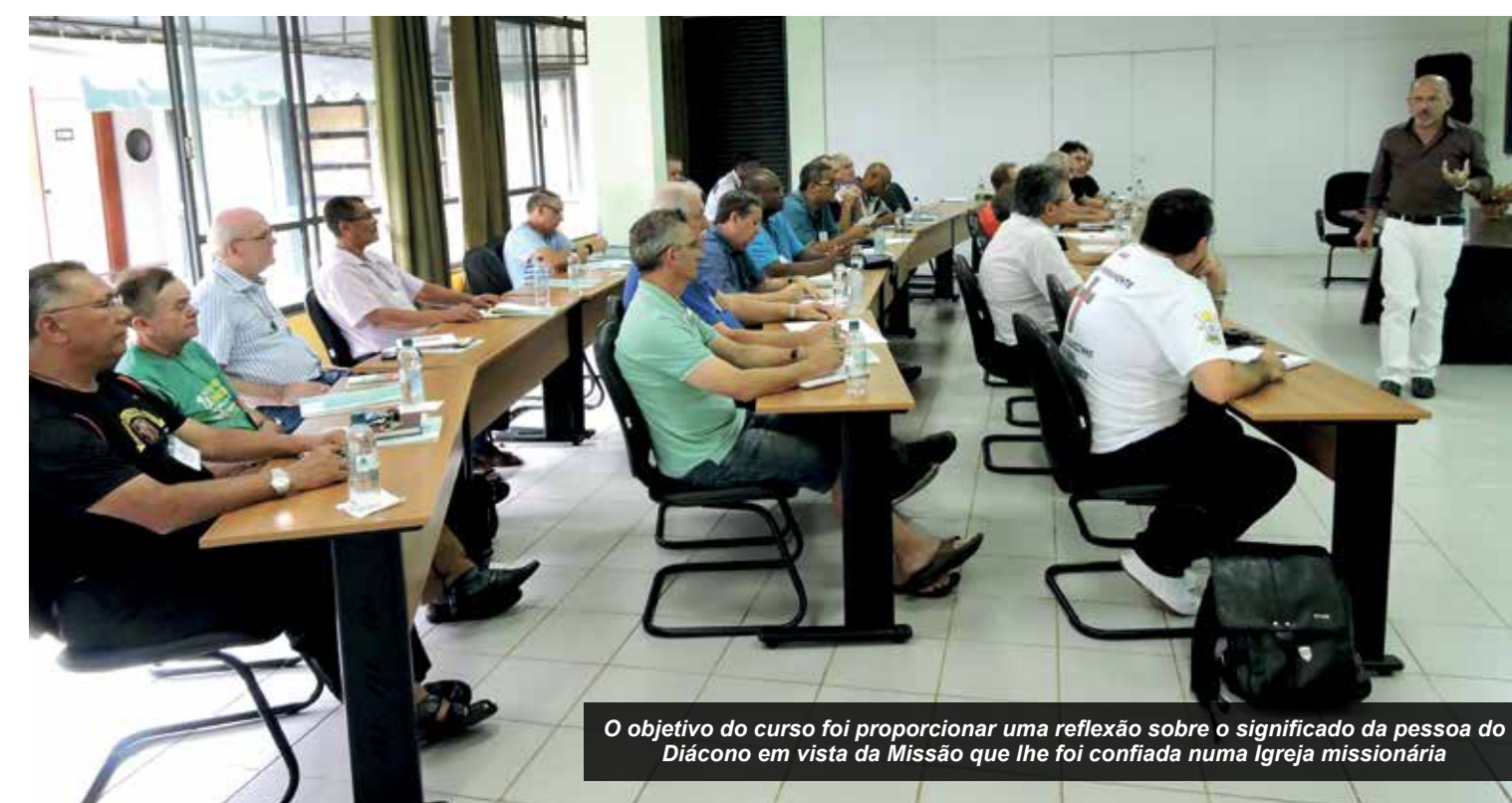
O objetivo do curso foi proporcionar uma reflexão sobre o significado da pessoa do Diácono em vista da Missão que lhe foi confiada numa Igreja missionária