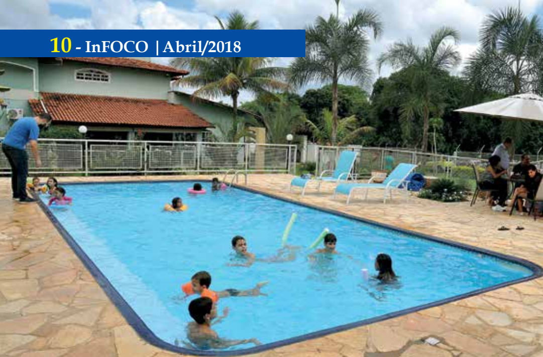
A criançada sob a supervisão de Manu fez a festa na piscina aquecida e na área verde com jogo de meia trava. Os adultos disputaram um torneio de sinuca

Por esta atividade missionária, Deus é plenamente glorificado (Ad Gentes, 7)